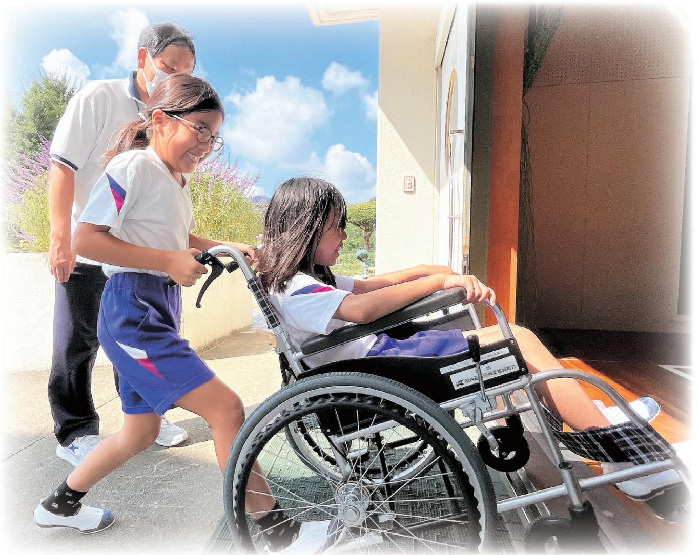
▲福祉学習（洲本市立中川原小学校）