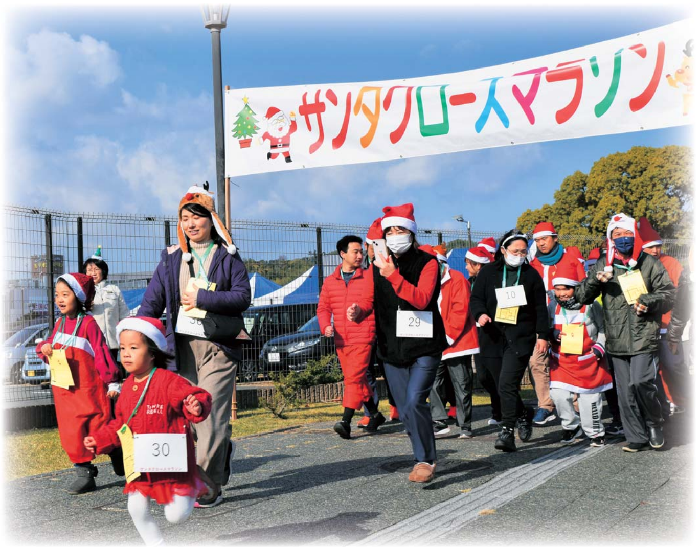
▲12月3日(日) サンタクロースマラソン