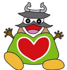
洲本市社協キャラクター